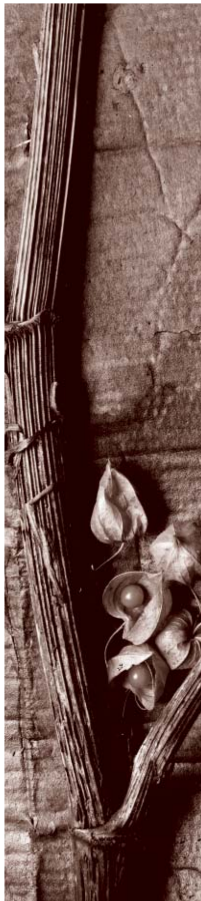
Verarbeitung mit Schwefeltoner: Das Motiv erhält einen rotbraunen Bildton.