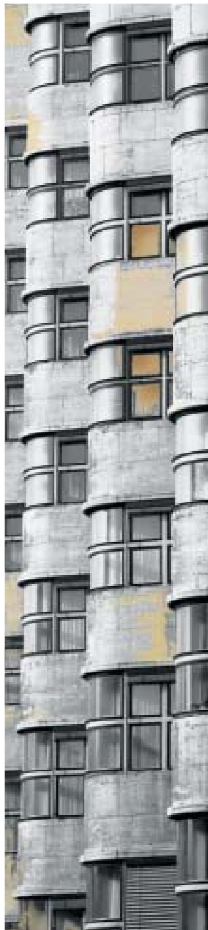
Ohne SISTAN: Durch Schwefelwasserstoff und Sauerstoff aus der Luft hat sich Silbersulfid gebildet und eine gelbbraune Verfärbung verursacht.