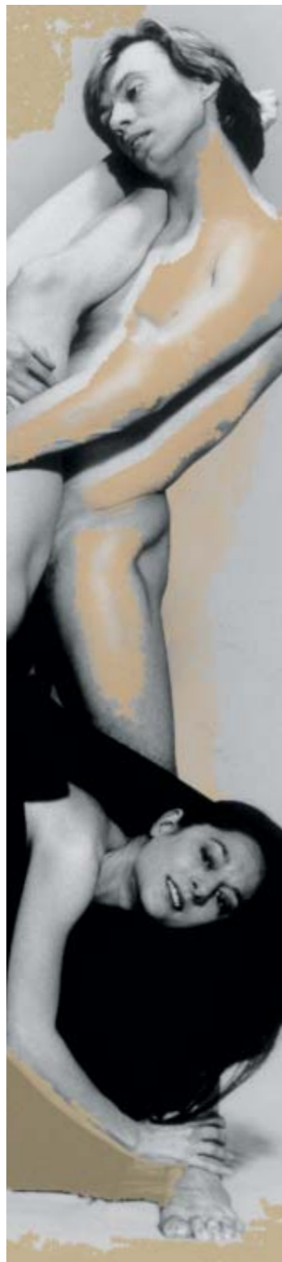
Ohne SISTAN: Durch Umwelteinflüsse hat sich kolloidales Silber gebildet.