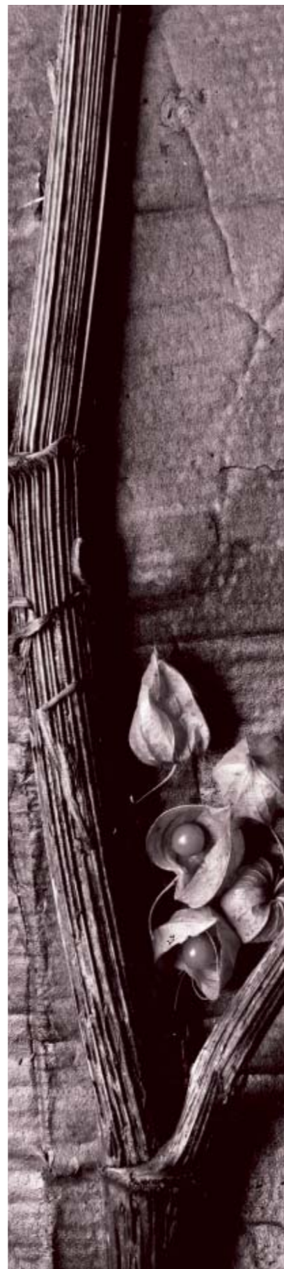
Verarbeitung mit Selentoner: Das Motiv wird durch einen braunvioletten Bildton verändert.