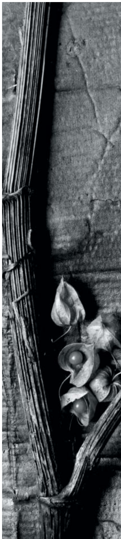
Ausschnitt aus einem SW-Motiv von Eberhard Grames. Zustand des Bildes nach der Verarbeitung mit SISTAN. Der Bildton bleibt unverändert.