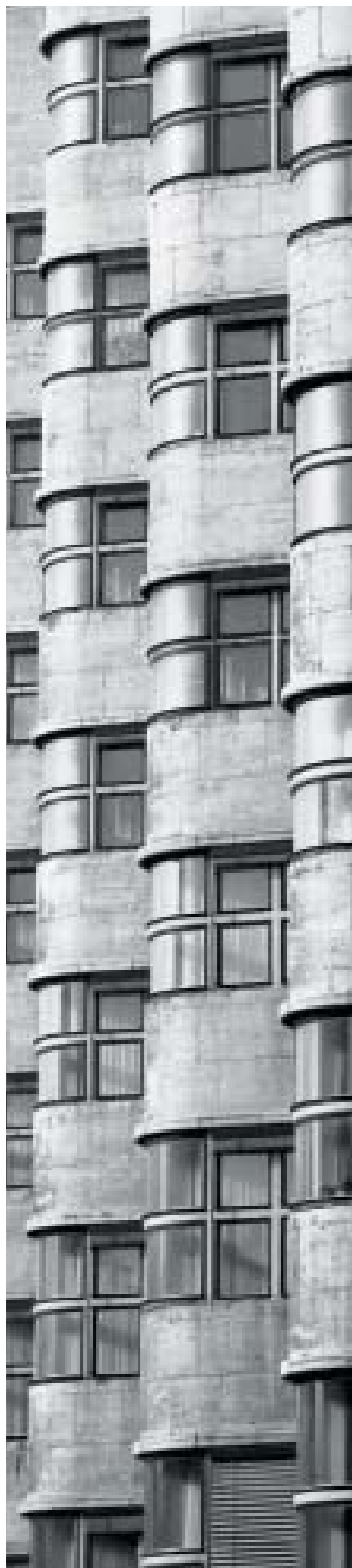
Ausschnitt aus einem SW-Motiv von Markus Bollen. Zustand des Bildes mit dem gewünschten Bildton nach der Verarbeitung mit SISTAN.