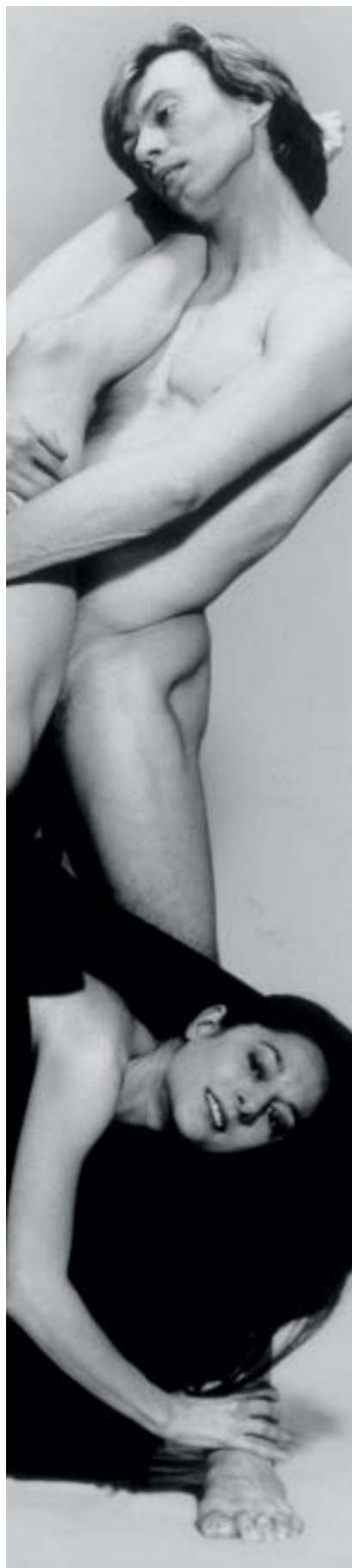
Ausschnitt aus einem SW-Motiv von Dieter Blum. Zustand des SW-Prints mit dem gewünschten Bildton unmittelbar nach der Verarbeitung.