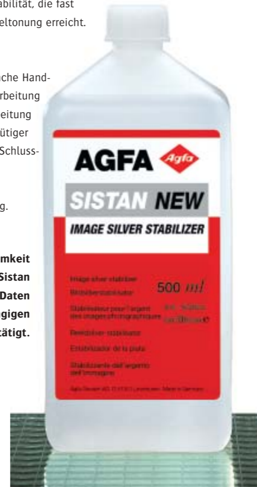
SISTAN schützt schnell, einfach und geruchsfrei

Der Unterschied zwischen dem Einsatz von SISTAN und Tonern besteht nicht nur im bildtonneutralen Ergebnis und in der einfachen Handhabung. Ebenso wichtig ist die geruchsfreie Verarbeitung, die sicherstellt, dass die Anwender nicht durch unangenehme Gerüche belästigt werden. Ein weiterer Vorteil von SISTAN liegt in der Berücksichtigung des Umweltschutzes: Das sehr ergiebige Konzentrat ist schwermetallfrei und ermöglicht mit 50ml Konzentrat pro Liter Gebrauchslösung eine Verarbeitungsleistung für alle SW-Materialien von 2 qm.