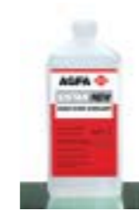
SISTAN schützt vor den Folgen der Oxidation