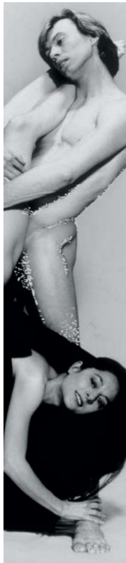
Ohne SISTAN: Hier ist durch Umwelteinflüsse ein sogenannter Silberspiegel entstanden.