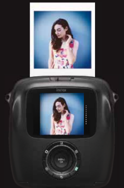
Sofortbild mit Vignettenfilter