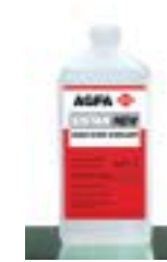
SISTAN schützt vor den Folgen der Oxidation